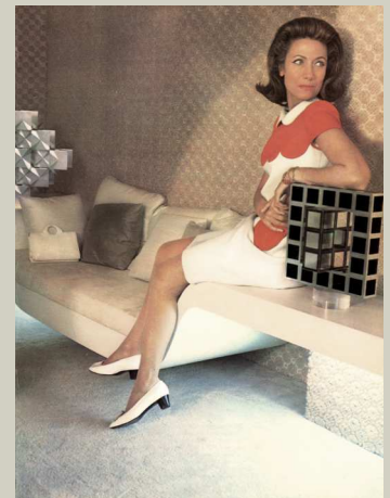
Horst P. Horst © Vogue Paris, Novembre 1968